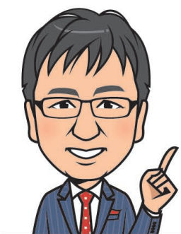
長井ゼミ主宰・医師 長井 敏弘 医療法人ハンス理事長、元岡山大学医学部臨床教授 TV番組出演および学校関係の講演会など幅広く活躍