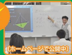
映像授業 動画・CGを 白板に映写