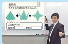
「ハイブリッド授業」が分かりやすい!!